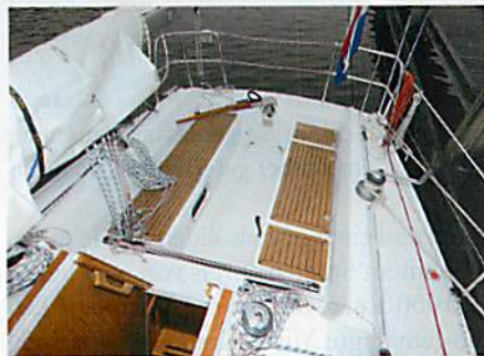
Gelungen: Die Plicht ist ergonomisch sinnvoll gestaltet. Selten: Pinne statt Rad