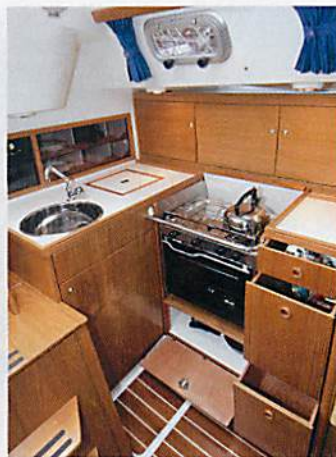
Geräumig: Die Pantry bietet viel Platz zum Arbeiten und Stauen