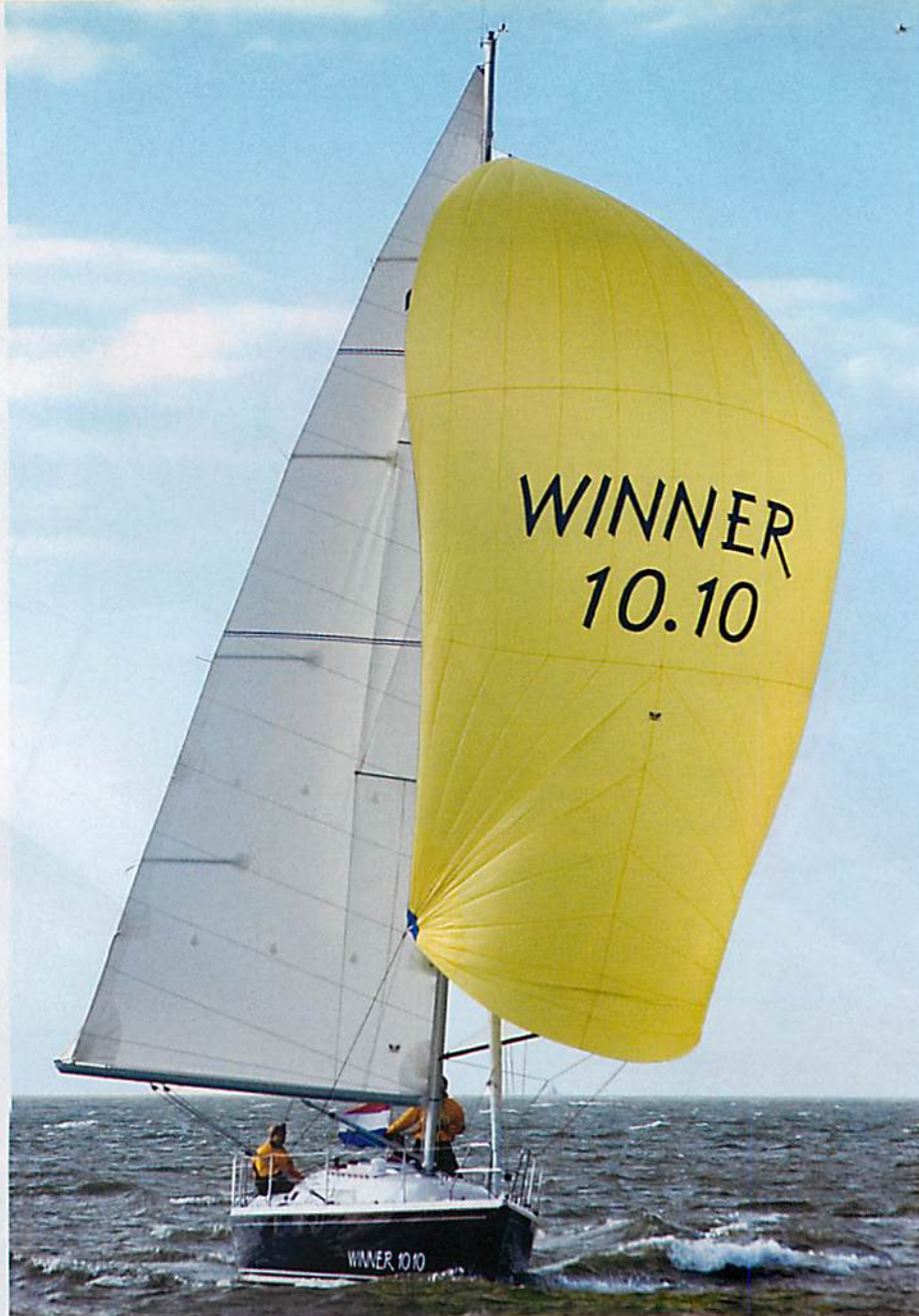
Spaß auf Rauschfahrt: Platt vor dem Laken segelt die Winner auch bei viel Wind unter Spinnaker erstaunlich sicher und kontrollierbar. Die blaue Rumpffarbe ist ein Extra

Zuverlässig schiebt der 3-Zylinder-Einbaudiesel von Yanmar das 4,3 Tönnen schwere Boot durch die auflaufende Welle in der Hafeneinfahrt. Zeit, sich mit der Bedienung des Schiffs anzufreunden. Fallen und Strecken laufen geordnet über das Kajütdach auf die Dachwischen hinter den Stopperbatterien. Zwei ausreichend dimensionierte Winschen warten auf dem Süll auf ihren Einsatz zum Dichtholen der Fock. Die Großschot läuft auf einem langen Traveller vor dem Niedergang. Die Grob- und Feineinstellungen des Schotzugs über Täljen sind Teil eines Performance-Pakets, mit dem auch die Baunummer 1 ausgerüstet ist. Dazu gehören außerdem leinenverstellbare Holepunkte für die Genuaschiene sowie zusätzliche Faltenstopper auf dem Dach. Für etwas mehr als 2000 Euro Aufpreis kriegt man diese regattataugliche Zusatzausrüstung.