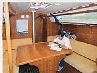
Praktisch: Der üppige Salontisch wird bei Bedarf auch ganz klein