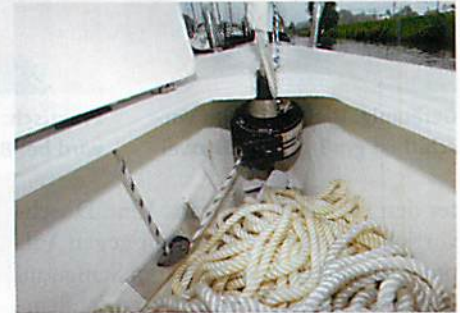
Gekonnt: Die Trommel der Rollreffanlage ist leistungsfördernd unter Deck montiert