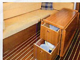
Schlau: gut genutzter Stauraum im sauber gefertigten Salontisch

tet den üblichen Komfort. Eine Duschvorrichtung gibt es jedoch nur gegen Aufpreis. An einer demontierbaren Stange auf Kopfhöhe lässt sich nasses Ölzeug aufhängen und trocknen.