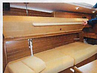
Funktionell: nicht nur Wachkoje, sondern vollständiges Bett