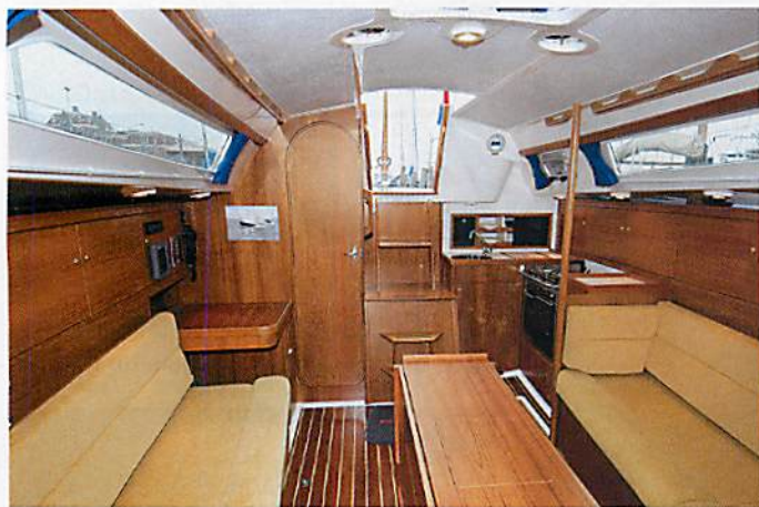
Angenehm: Ungebeiztes Teakholz sorgt im Innenausbau für eine luftige, schöne und helle Atmosphäre. Die Linienführung ist simpel