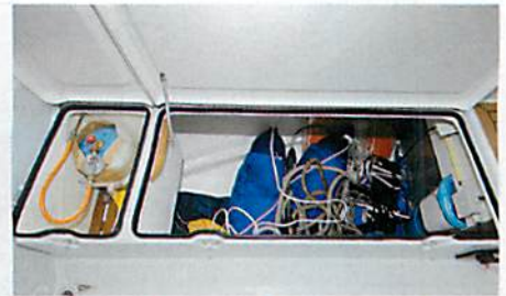
Geräumig: Die Backskiste bietet reichlich Platz, und im Gasfach ist Raum für Reserve