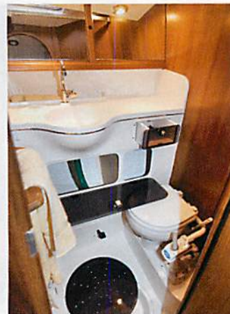
Komfortabel: die Nasszelle mit gehobenem Ausbau