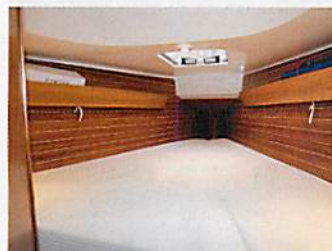
Geräumig: Die Kabine im Vorschiff ist groß genug für zwei