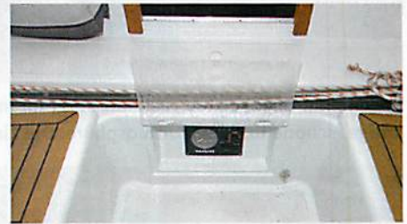
Geschützt: Das Instrumentenpaneel der Maschine sitzt an einem sicheren Ort