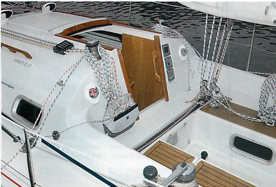
Geordnet: Trotz viel Schotenmaterials im Cockpit bleibt die Übersicht gewahrt. Am Brückendeck stört der Traveller nicht. Die Instrumente sind versenkt, die Kompass nicht