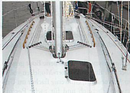
Geführt: Strecker und Fallen laufen zurück ins Cockpit. Groß: Luk für die Nasszelle